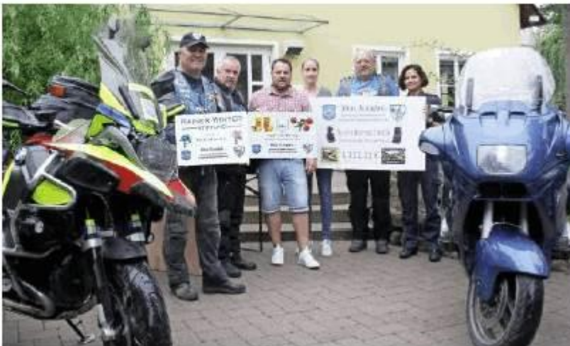
Die „Blue Knights“ bei der Spendenübergabe

Ein Mitglied der Blue Knights „verdoppelte“ die Spendensumme, so dass am Ende 1111,11 Euro überreicht wurden. red